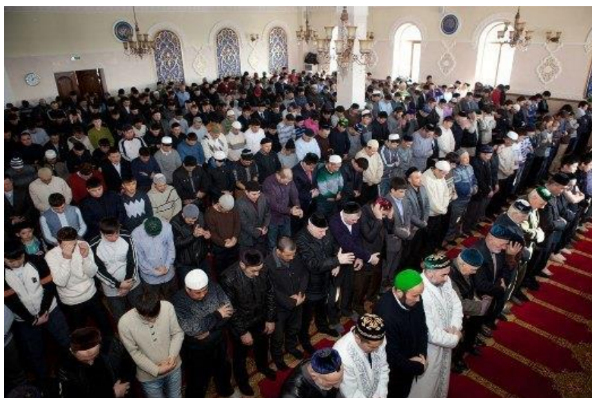
Рис. 7. Размещение молящихся плечом к плечу

Продолжение исследований в этом направлении позволит определить более точные значения площадей для людей различного пола и возраста. Связь количества посетителей и площади, занимаемой одним человеком, крайне необходима для проектирования здания и решения задач, связанных с обеспечением безопасности.