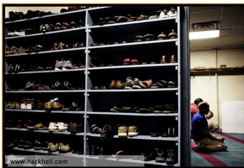
Рис. 5. Специально оборудованные полки для обуви при входе в молитвенный зал

Особенностью процесса эвакуации из мечетей является то, что при входе в молитвенный зал весь функциональный контингент снимает обувь и располагает её на специально оборудованных полках, которые расположены по ходу движения в молитвенный зал (рис. 5). Очевидно, что в случае пожара часть эвакуирующихся прихожан поспешат забрать свою обувь, тем самым образовав скопление и задержку людского потока в мечети.