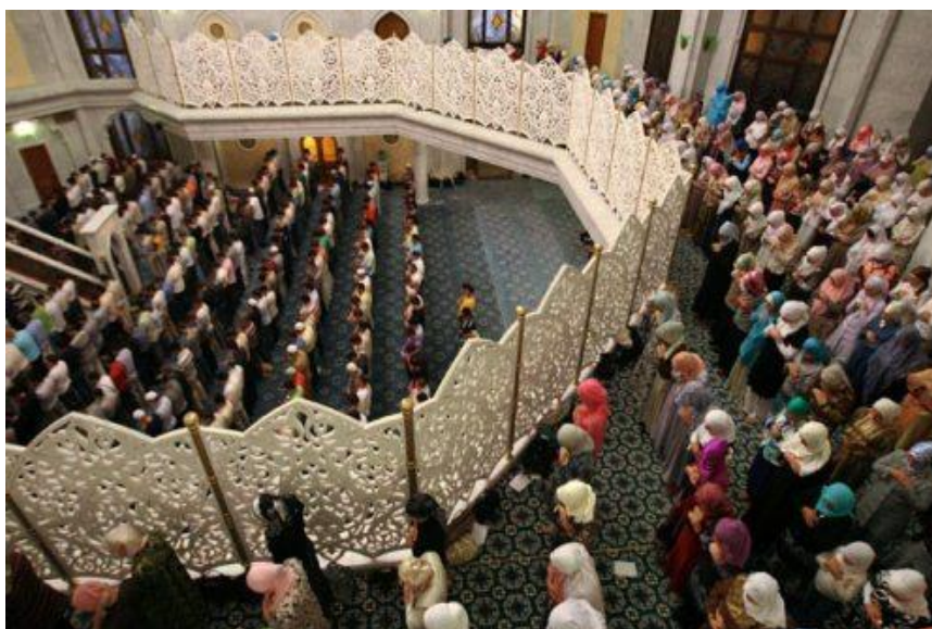
Рис. 6. Мужской и женский молитвенные залы

Следует также отметить ещё одну существенную особенность мечетей, по сравнению с культовыми зданиями других вероисповеданий: разделение мужских и женских залов. Ещё с древних времён в мечетях оборудовался изолированный молельный зал для женщин с самостоятельным входом либо специальный балкон, отделённый от зала непрозрачным занавесом, иногда в небольших мечетях можно увидеть ширму (рис. 6). Главным условием является то, чтобы все прихожане могли слышать голос имама в мечети [5]. Соответственно мужской и женский молитвенные залы будут иметь различные пути эвакуации .