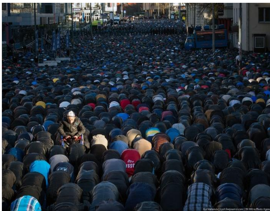
Рис. 2. Молитва на улице при переполненной мечети

Количество мечетей в Казахстане составляет более 2,5 тыс., в России – более 7 тыс. Следует отметить тенденцию к их строительству – за последние 30 лет число мечетей выросло более чем в 70 раз [2]. Причём, в настоящее время мечетей в больших городах недостаточно, это прослеживается хотя бы по тому, что каждое здание такого типа в особые дни (Курбан-байрам, Ураза-байрам, и др.) полностью заполнено людьми и молитвы происходят также на улице (рис. 2).