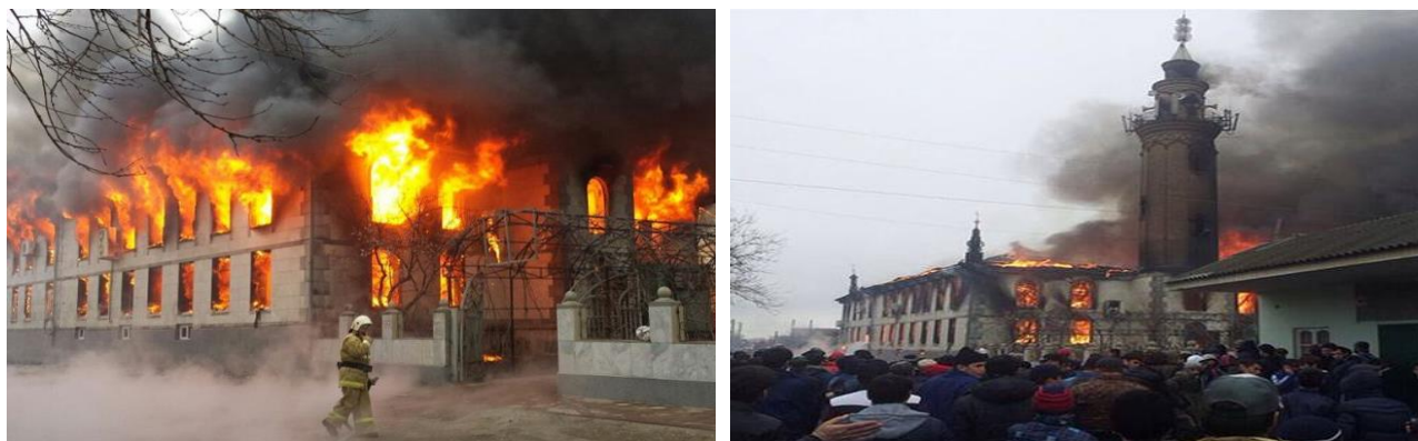
Рис. 3. Горит центральная мечеть в Кизляре (Дагестан)

Основными причинами возникновения пожаров в мечетях являются: нарушение правил эксплуатации электрооборудования, неосторожное обращение с огнём, нарушение правил установки и эксплуатации печей и дымоходов, нарушение правил эксплуатации бытовых газовых устройств, поджоги, террористические акты и т.д. Например, 16 января 2012 г. произошел пожар в самой крупной в центральной Азии мечети Хазрет Султан в Астане (рис. 3), а 10 апреля 2015 г. в Кизляре сгорела центральная мечеть города (рис. 4).