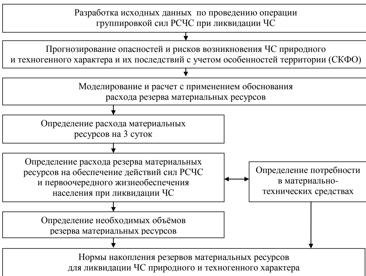
Рис. 2. Структура методики обоснования норм накопления резервов материальных ресурсов для ликвидации ЧС в субъекте РФ

Представленная структура методики позволит смоделировать действия группировки сил РСЧС и определить номенклатуру резервов материальных ресурсов с учётом специфики действий группировки сил РСЧС, включая особенности территорий в зоне ЧС.