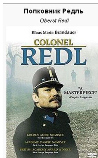
Афиша фильма "Полковник Редль"

Австрийская разведка перед Первой мировой войной. Перед Первой мировой войной австрийцев интересовала шифрованная переписка иностранных государств. В частности, они предпринимали попытки дешифровать итальянский код. Им удалось перехватить шифрованную переписку послов Италии в Риме и Константинополе. Итальянцы применяли не очень сложный код, но полностью раскрыть его по материалам перехвата австрийцы не смогли и предприняли следующий шаг. Они поместили в одной из газет, издаваемой в Константинополе на итальянском языке, любопытное сообщение со сведениями военного характера. Расчёт был прост. По предположению австрийцев, итальянский военный атташе в Турции дословно закодирует эту статью и отправит её в Рим. Так и произошло.